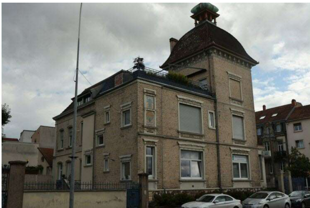
La Villa Couturier construite en 1890 à l'initiative de Léon Couturier.

En plein centre-ville de Forbach, les amateurs de belles demeures ne peuvent manquer les façades et la toiture de la Villa Couturier, à l'angle de la rue de la Gare et de l'avenue Saint-Rémy, et ceci d'autant moins qu'elle ne ressemble à aucune autre. Voici son histoire racontée par Jacques Koenig du Cercle des Furbacher.