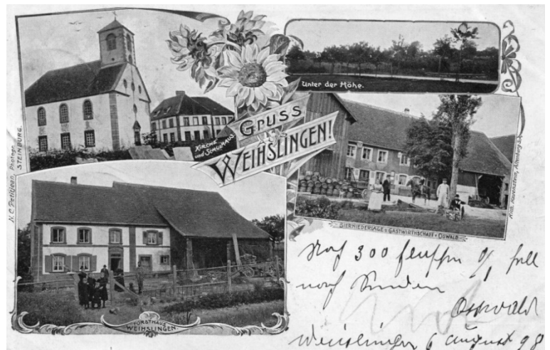
Carte postale Weislingen fin XIX e siècle - Coll. Eric Denninger

Sur les métiers exercés autrefois dans la région l'on pourra aussi consulter l'ouvrage de Charles Serfass (3) , où l'auteur évoque les métiers de la forêt, les sabotiers, vanniers, potiers, forgerons, etc.