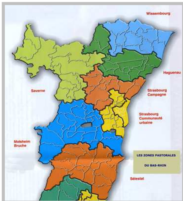
Les zones pastorales du Bas-Rhin

Le diocèse d'Alsace a ouvert en l'an 2000 un vaste chantier de réorganisation des paroisses, appelé "le réaménagement pastoral". La première étape de ce mouvement a d'abord concerné le découpage de l'Alsace en 14 zones pastorales.