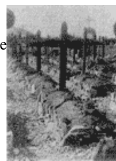
Photo de sa tombe en Serbie